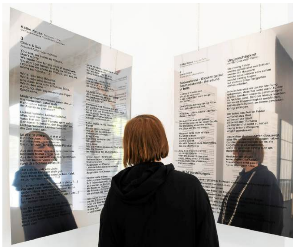
„Texte und Töne“ (2023).