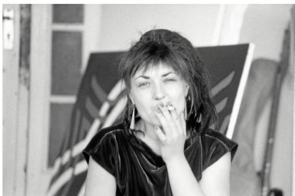
Käthe Kruse im Künstlerhaus Bethanien, 1985.