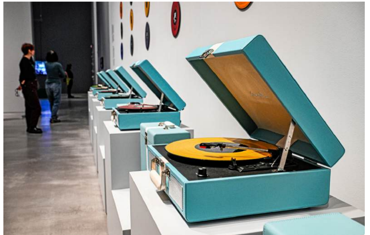
Eigene Arbeiten und das Vermächtnis der Kunstgruppe Die Tödliche Doris in neuer Gestalt: Einblicke in die Ausstellung, MAURIZIO GAMBARINI / FFS (3), LUDGER PAFFRATH

MAURIZIO GAMBARINI / FFS (3), LUDGER PAFFRATH