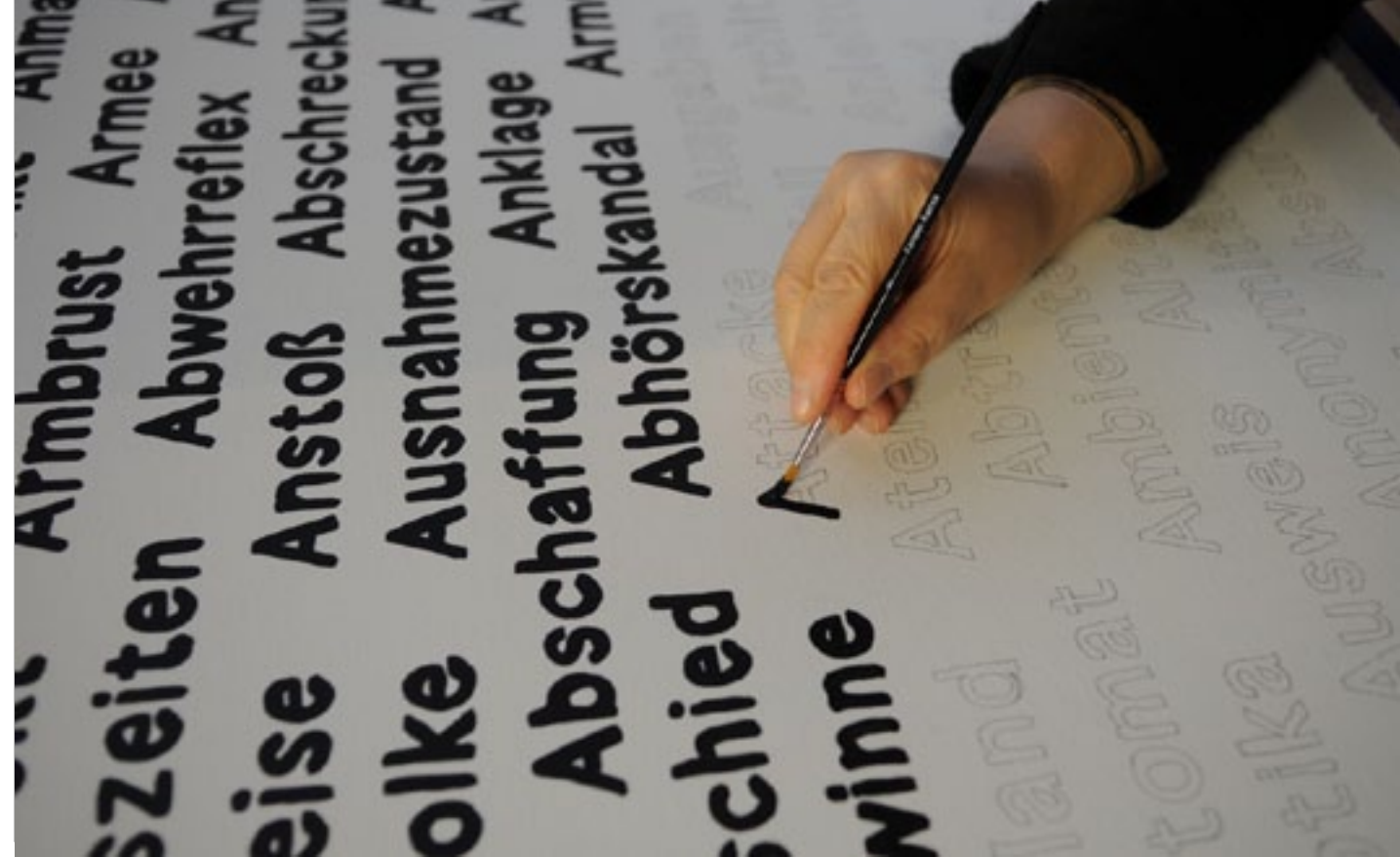
Käthe Kruse im Studio, fotografiert von Fokke Hoekmann, 2020